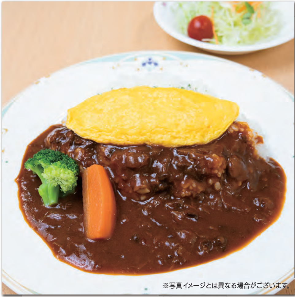
※写真イメージとは異なる場合がございます。