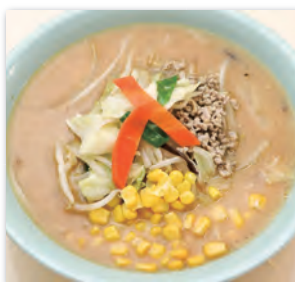
味噌ラーメン・・・¥800