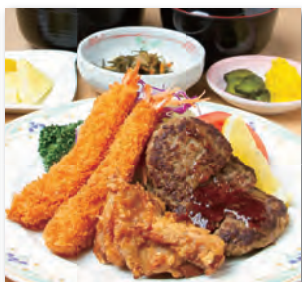
はすの実定食・・・¥1,000