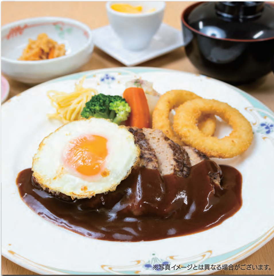
※写真イメージとは異なる場合がございます。