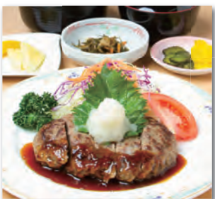
ハンバーグ定食・・・¥880