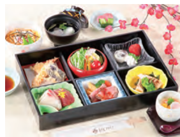
秋田由利牛ビーフシチュー御膳 2,500円(税込)