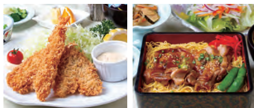
海鮮フライ御膳 国産鶏モモ肉の照り焼き重