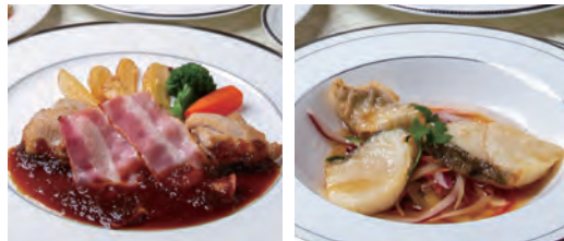
チキンソーテーベーコン添え 和風ソース 鱈の唐揚げ 彩り南蛮ソース