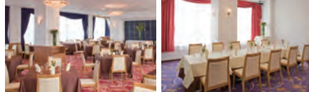
スカイレストラン「天空」 パティールーム「鳥海」

「天空」(10名様~40名様)をご利用希望のお客様は10日前までに、パーティールーム「鳥海」(5名様~10名様)をご利用希望のお客様は5日前までにご予約ください。