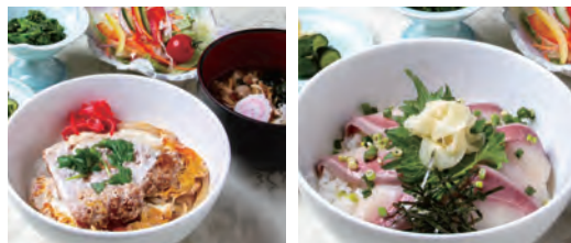
カツ丼と温天鰯うどんセット フリ丼