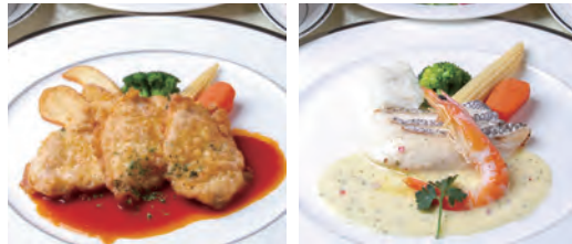
若鶏のピカタ トマトソース 鯛と海老のポワレ ガーリックバターソース