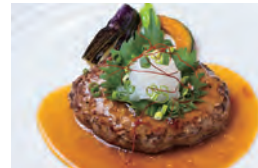
秋田由利牛ハンバーグ御膳 1,800円(税込)