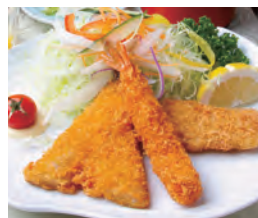
ミックスフライ定食