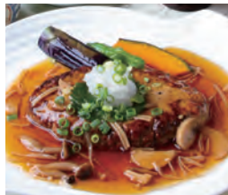
秋田由利牛豆腐ハンバーグ