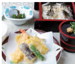
天鷲うどんと天婦羅セット