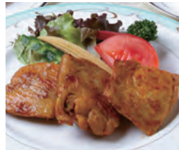
タンドリーチキン サラダ添え