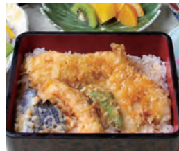
魚介と夏野菜の天重