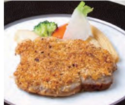
豚ロース香草パン粉焼き