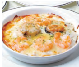
シーフードグラタン