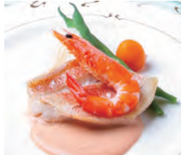
カサゴと小海老のポワレ