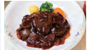
秋田由利牛ビーフシチュー御膳 2,400円(税込)