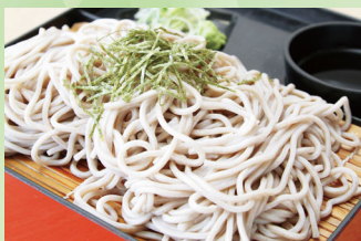
ざるそば(うどん・中華) ¥800