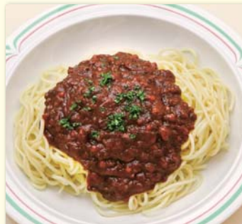
ミートソーススパ(サラダ付き)・¥580