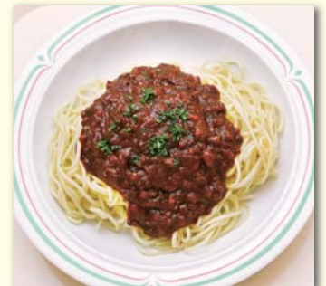
ミートソーススパ(スープ、サラダ付)・¥580