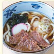
きつねそば/うどん ..... ¥480