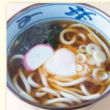
月見そば/うどん ..... ¥450