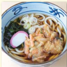
かき揚げそば/うどん ..... ¥540