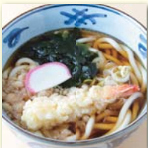
天ぷらそば/うどん ..... ¥560