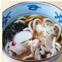
肉そば/うどん ..... ¥520