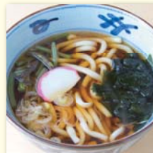
山菜そば/うどん ..... ¥500