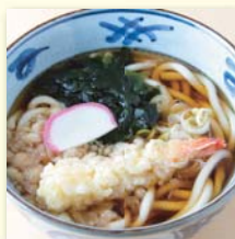
天ぷらそば/うどん .....¥560