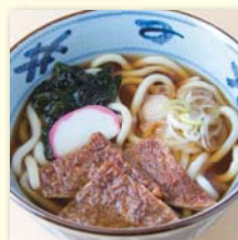
きつねそば/うどん .....¥480