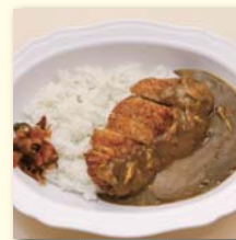
カツカレー(サラダ付) .....¥670