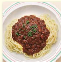
ミートソーススパ(サラダ付) .....¥560