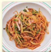
ナポリタン(サラダ付) .....¥520