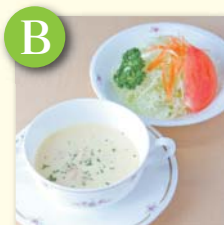
B スープ&ミニサラダ ..... ¥270