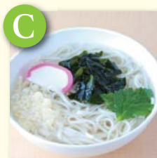
C ミニ稲庭うどん ..... ¥350