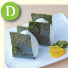
D おにぎり・梅/鮭 ..... ¥260