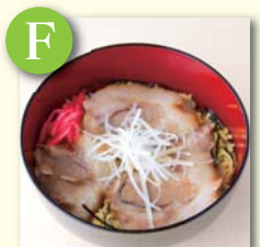
F ミニチャーシュー丼 ..... ¥320