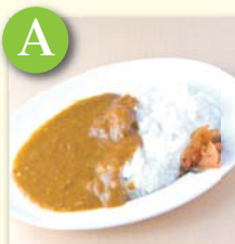
A ミニカレー ..... ¥270