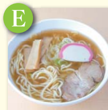
E ミニラーメン ..... ¥280