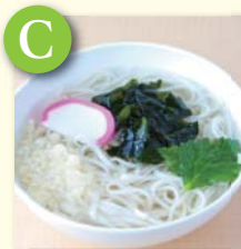
C ミニ稲庭うどん .....¥350