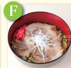
F ミニチャーシュー丼 .....¥320