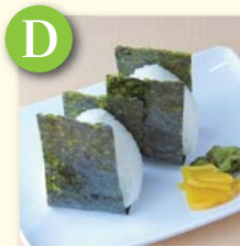
D おにぎり・梅/鮭 .....¥260