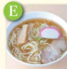
E ミニラーメン .....¥280