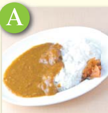
A ミニカレー .....¥270