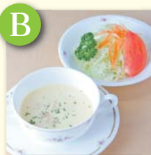
B スープ&ミニサラダ .....¥270