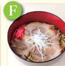
F ミニチャーシュー丼 .....¥320