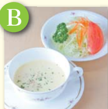
B スープ&ミニサラダ .....¥270